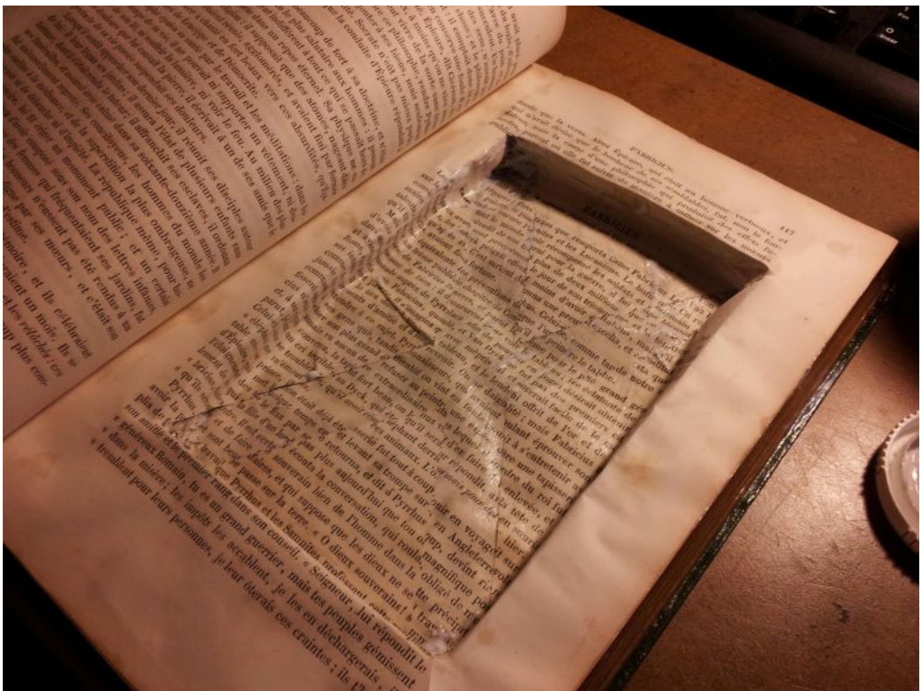
Illustration : étagères-coffre-fort

écrit par Pascal Tenand | 28 février 2019