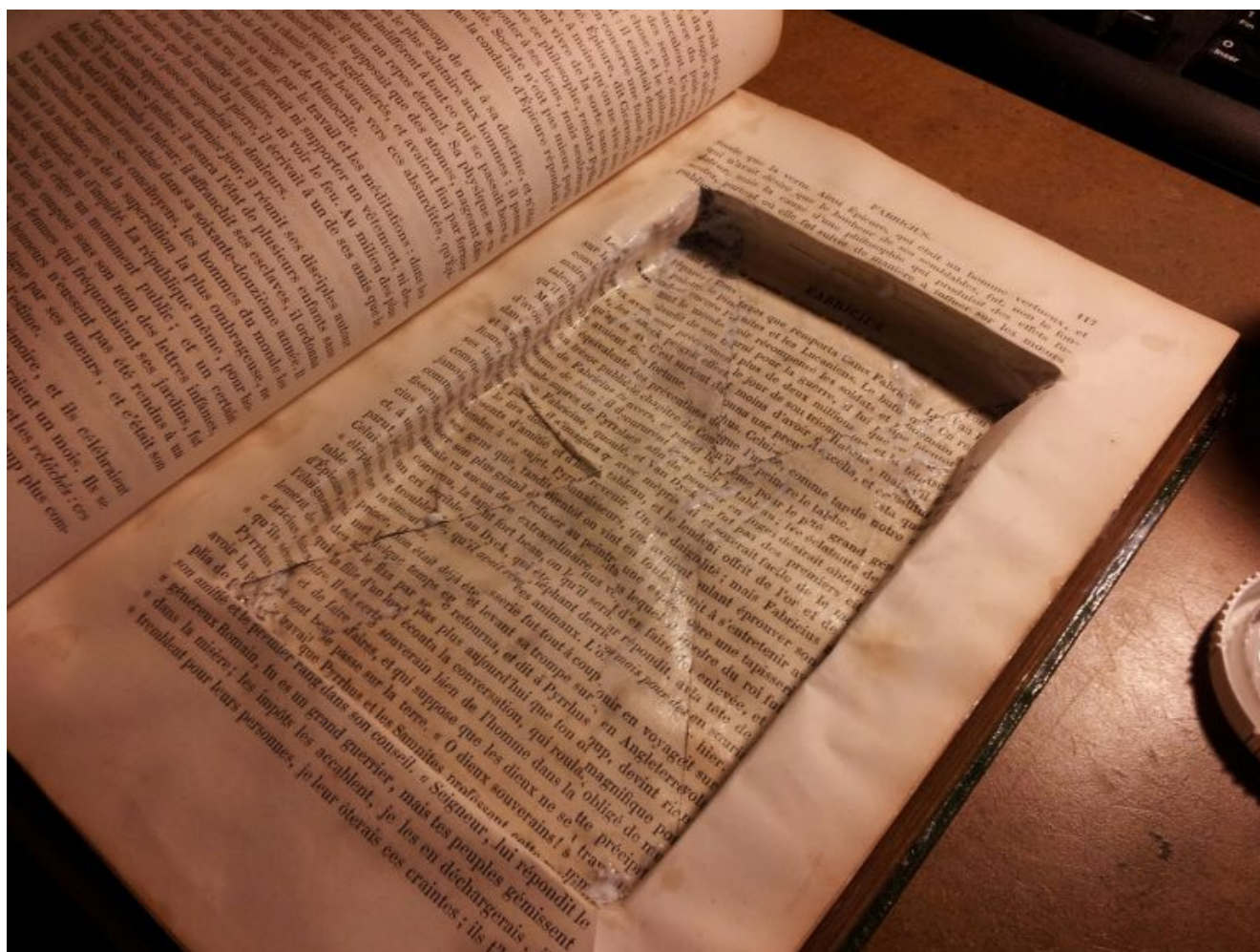
Illustration : étagères-coffre-fort

écrit par Pascal Tenand | 28 février 2019