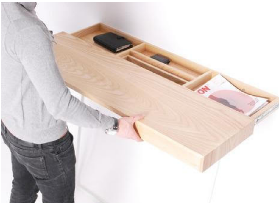
les étagères coffre fort.

La multiplicité existante de ces dispositifs sera pour vous une autre garantie de sécurité.