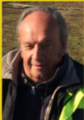
Gilet Jaune (Morbihan)