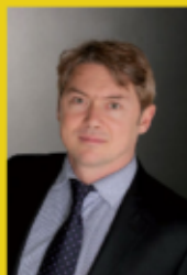
Avocat de Gilets jaunes