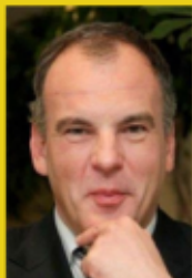
Président du Rassemblement des Contribuables Français