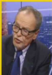
Economiste, spécialiste de l'immigration