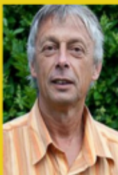
Fondateur de Riposte Laïque