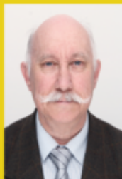
Militaire, auteur de "L'espérance, Notre rêve pour la France"