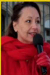
Présidente de Résistance Républicaine