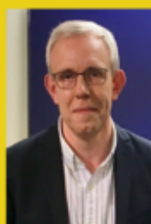
Directeur des programmes de TV-Libertés