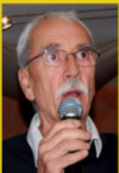
Président de "La Ligue du Midi"