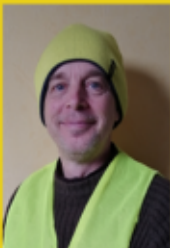
Gilet Jaune (Paris)