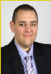
Secrétaire général du syndicat France Police