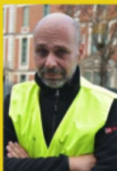
Initiateur du mouvement des Gilets jaunes