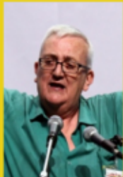
Député européen italien de la Ligue du Nord