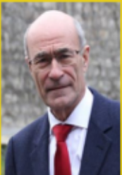
Président de Polémia