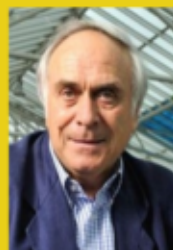
Président du site suisse "Les Observateurs"