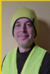
Gilet Jaune (Paris)