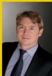
Avocat de Gilets jaunes