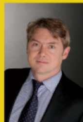
Avocat de Gilets jaunes