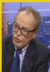
Economiste, spécialiste de l'immigration