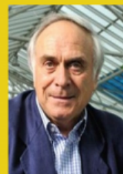
Président du site suisse "Les Observateurs"