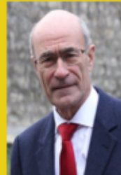
Président de Polémia