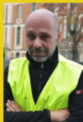
Initiateur du mouvement des Gilets jaunes