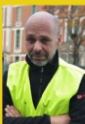
Initiateur du mouvement des Gilets jaunes