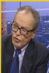
Economiste, spécialiste de l'immigration