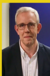
Directeur des programmes de TV-Libertés