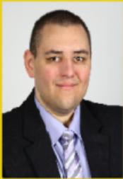
Secrétaire général du syndicat France Police