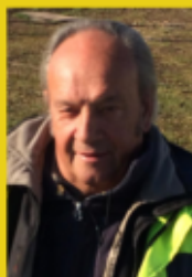
Gilet Jaune (Morbihan)