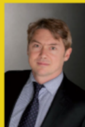
Avocat de Gilets Jaunes