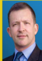
Conseiller régional apparenté RN Occitanie