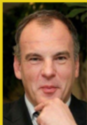
Président du Rassemblement des Contribuables Français