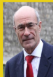
Président de Polémia