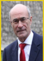
Président de Polémia