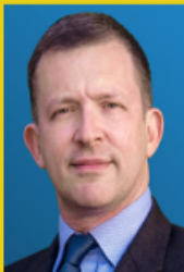
Conseiller régional apparenté RN Occitanie