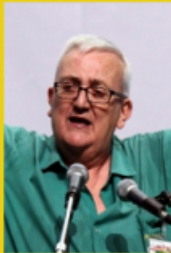
Député européen italien de la Ligue du Nord