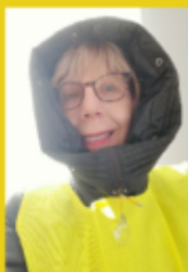
Gilet Jaune (Orne)