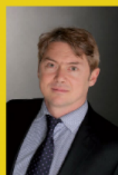
Avocat de Gilets jaunes