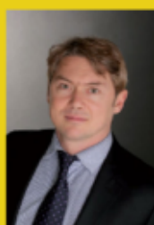
Avocat de Gilets Jaunes