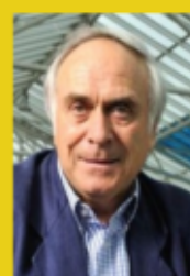
Président du site suisse "Les Observateurs"