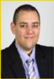
Secrétaire général du syndicat France Police