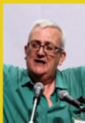
Député européen italien de la Ligue du Nord