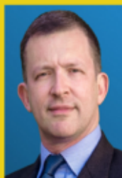
Conseiller régional apparenté RN Occitanie