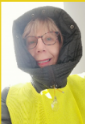
Gilet Jaune (Orne)