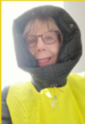
Gilet Jaune (Orne)