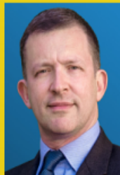
Conseiller régional apparenté RN Occitanie