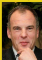
Président du Rassemblement des Contribuables Français