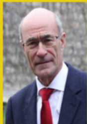
Président de Polémia