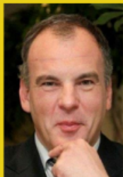
Président du Rassemblement des Contribuables Français