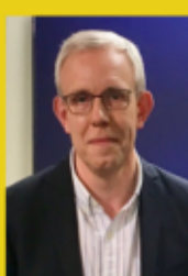
Directeur des programmes de TV-Libertés