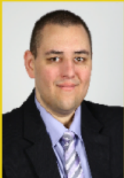
Secrétaire général du syndicat France Police