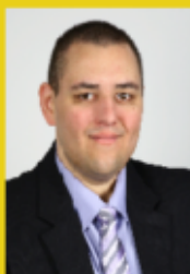
Secrétaire général du syndicat France Police