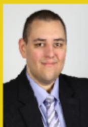
Secrétaire général du Syndicat France Police