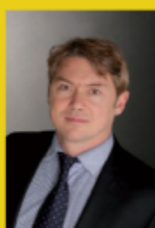
Avocat de Gilets jaunes