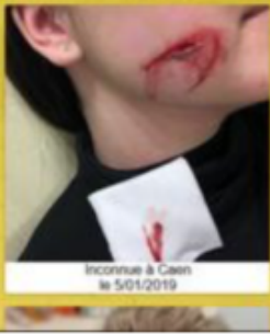
Inconnue à Caen le 5/01/2019