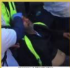
Inconnu à Montpellier le 5/01/2019