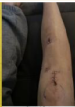
Séven à Paris le 8/12/2018