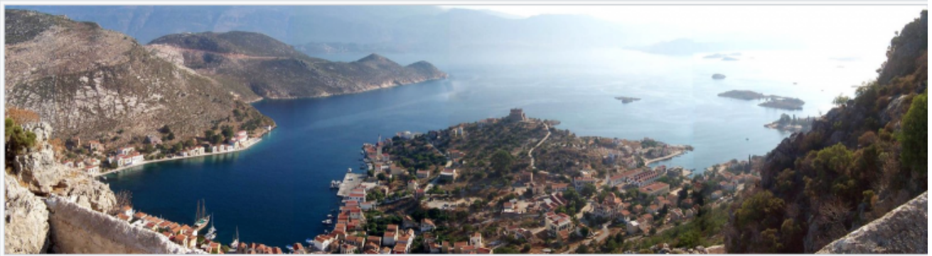
Vue panoramique du port de Megisti

Erdogan aurait-il l'intention d'annexer les petites îles qui se trouvent à quelques encablures de la Turquie, comme la petite île de Kastellórizo, qui se trouve seulement à 2 km des côtes turques ?