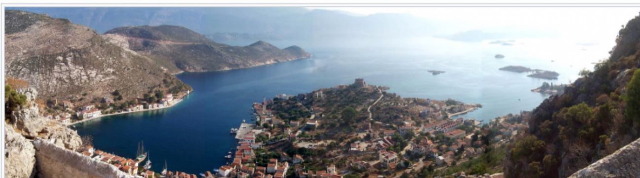
Vue panoramique du port de Megisti

Erdogan aurait-il l'intention d'annexer les petites îles qui se trouvent à quelques encablures de la Turquie, comme la petite île de Kastellórizo, qui se trouve seulement à 2 km des côtes turques ?