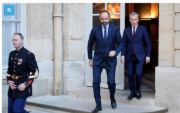
Le Premier ministre Edouard Philippe et le ministre de la Transition écologique François de Rugy n'ont pu discuter qu'avec un seul Gilet jaune vendredi après-midi.

Illustration : petit montage fait à partir de la photo originale ci-dessous :