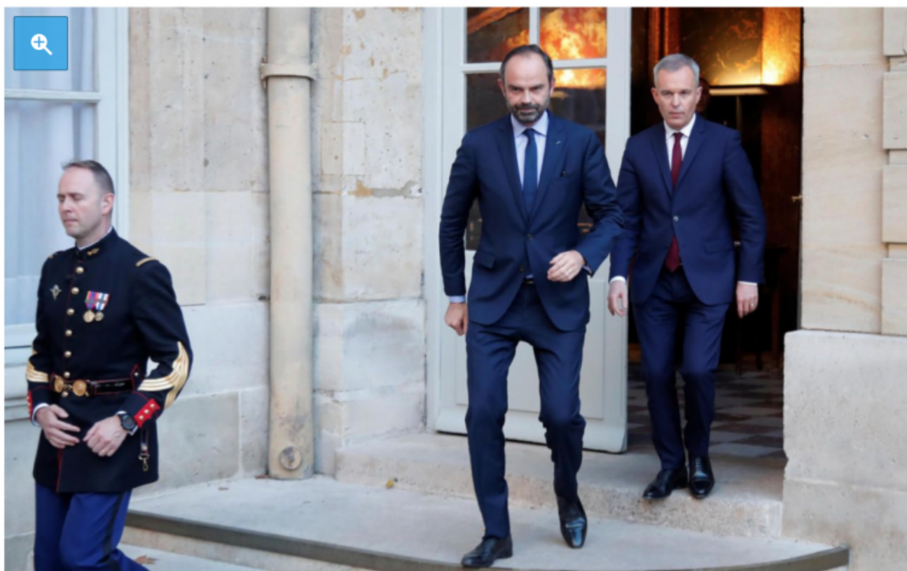
Le Premier ministre Edouard Philippe et le ministre de la Transition écologique François de Rugy n'ont pu discuter qu'avec un seul Gilet jaune vendredi après-midi.