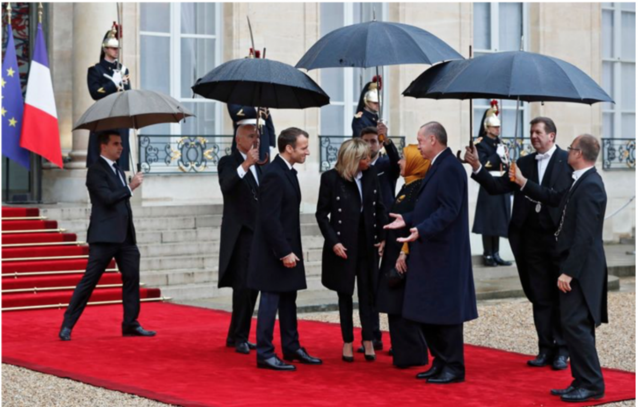
Emmanuel Macron accueille son homologue turc Recep Tayyip Erdogan à l'Elysée.