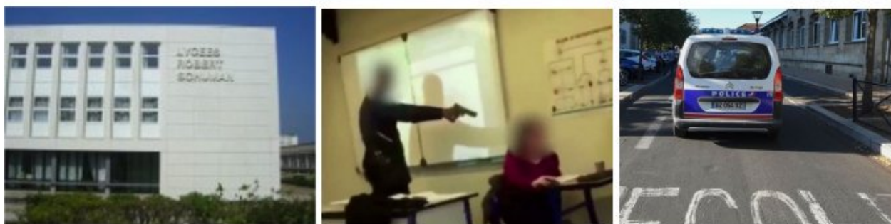
La médiatisation de l'affaire de Créteil a « libéré » la parole de personnels de l'éducation nationale

La diffusion sur les réseaux sociaux et la médiatisation d'une vidéo montrant une enseignante braquée avec une arme factice par un de ses élèves dans un lycée de Créteil (94) ont incité plusieurs personnels de l'éducation nationale à dénoncer auprès des DDSP d'Amiens (80), Le Havre (76), Le Mans (72) et Pont-à-Mousson (54) des faits similaires ou proches.