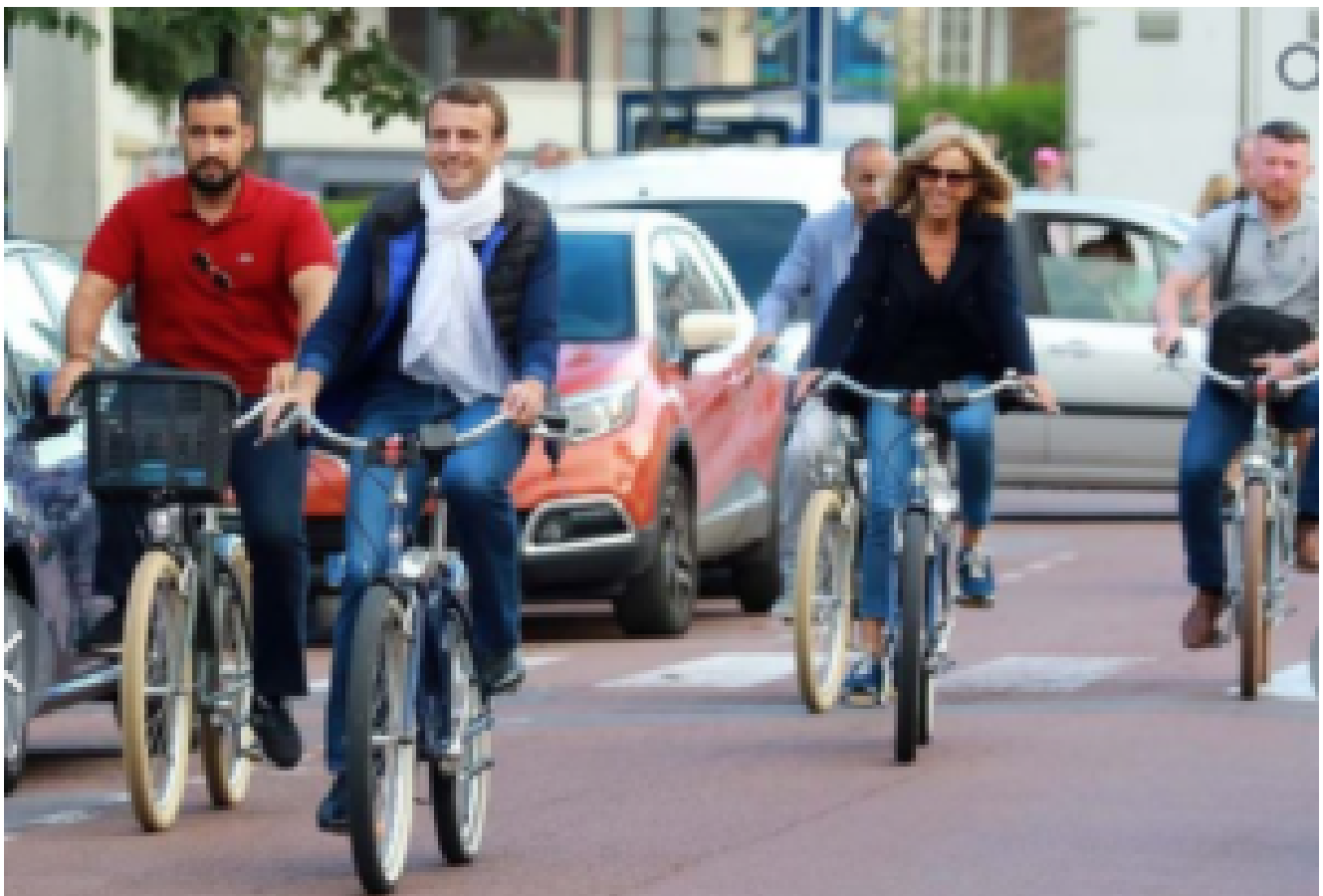
Photo 10 Benalla accompagne Macron, mais pas en tenue, lui,