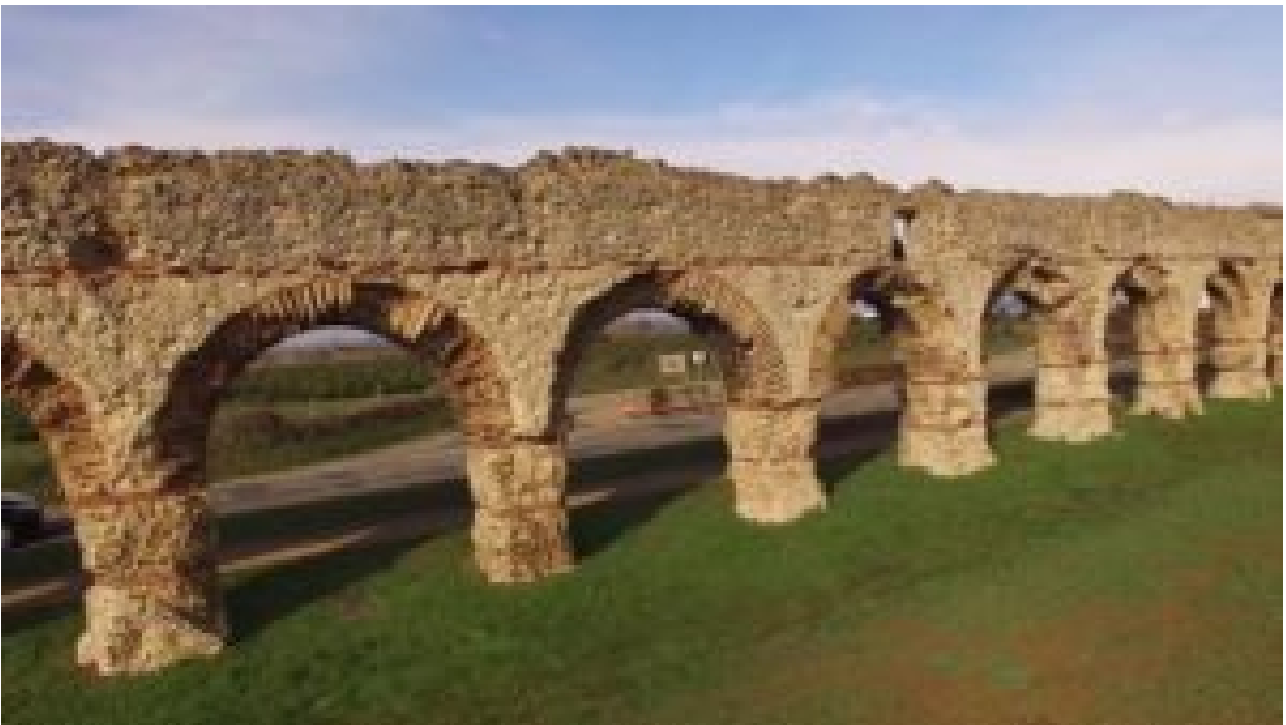
... l'aqueduc romain du Gier (Rhône)...