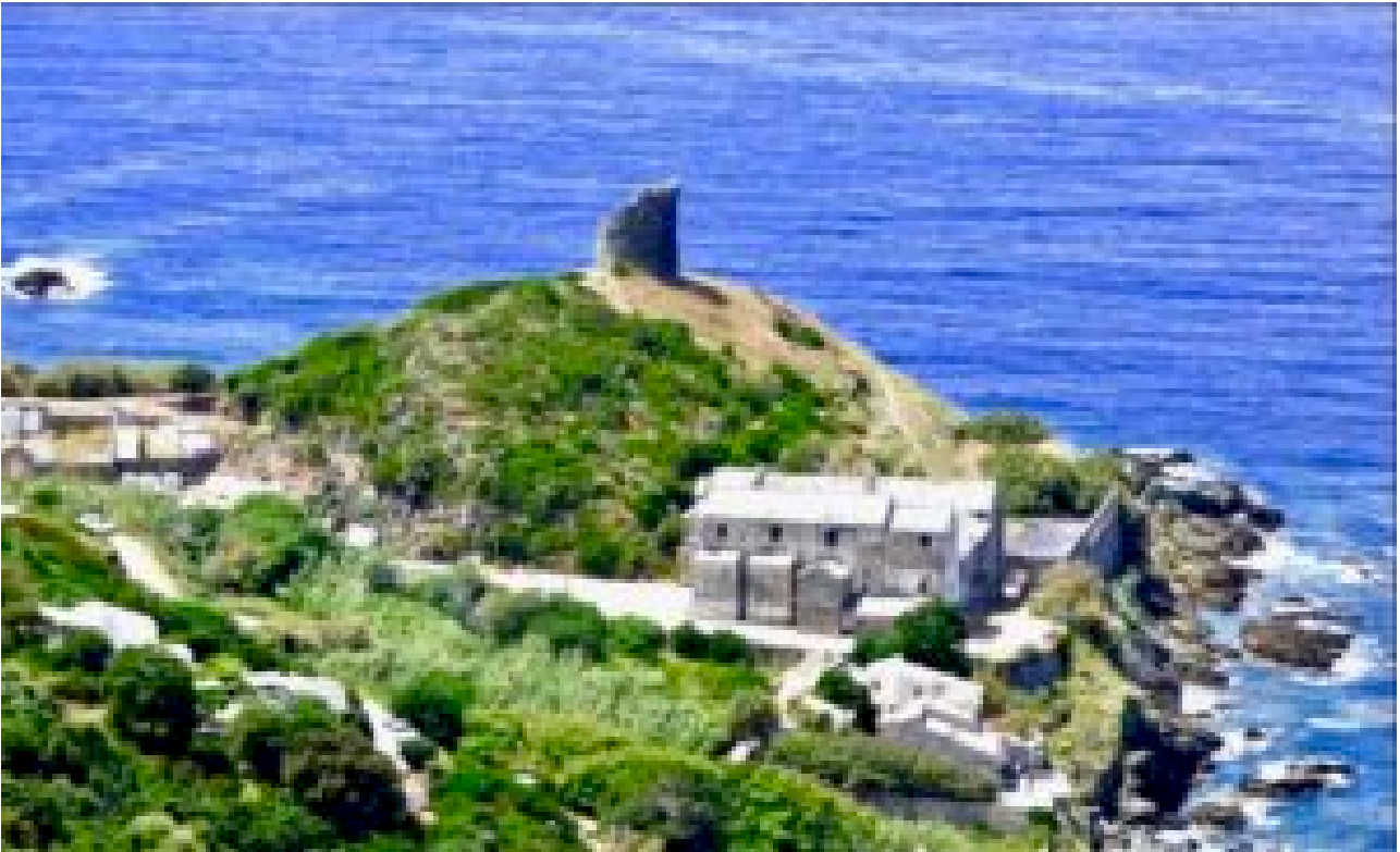
... le couvent Saint-François de Pino (Haute-Corse)...