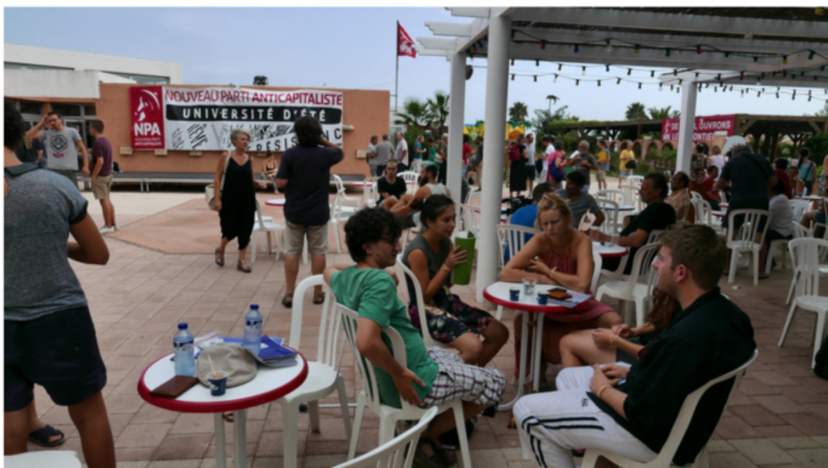
Du 26 au 29 août inclus, on trouvera (presque) tout à Port-Leucate, au bord de la mer Méditerranée. Le plein de rencontres, de lieux et de thèmes...

Twitter J'aime 72 Partager 72 université d'été 2018