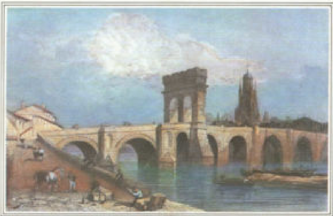
Le Vieux Pont de Saintes en 1850