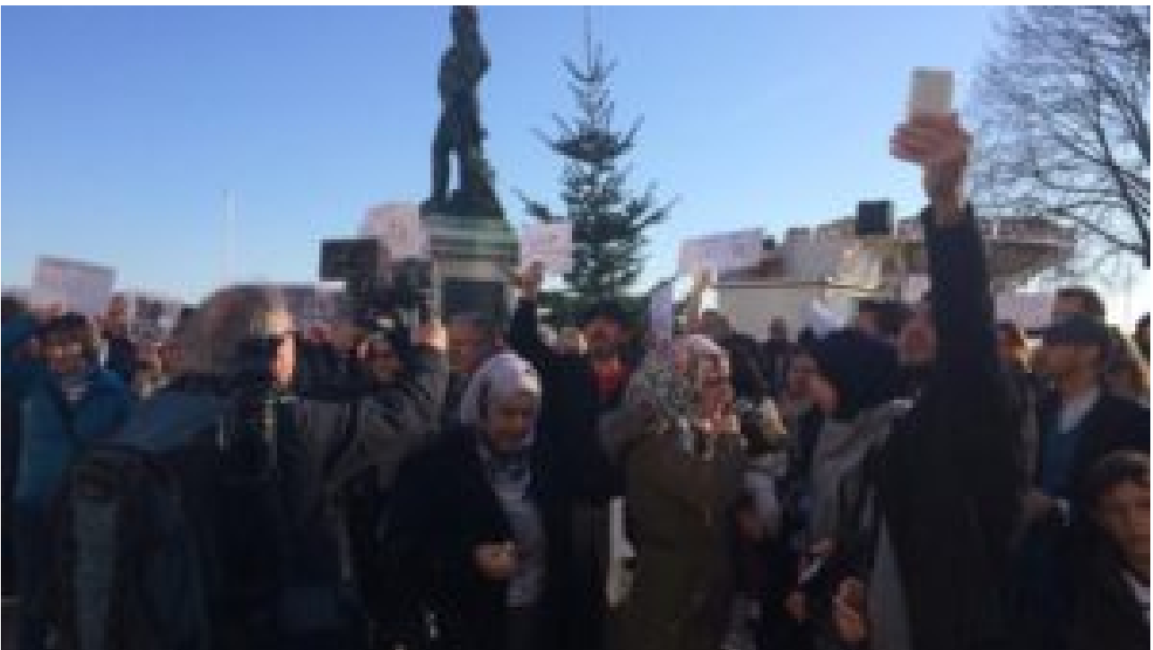
Rassemblement de soutien aux victimes d'Alep à La Rochelle en 2016

Où sont-ils les islamogauchistes locaux , ceux qui manifestaient contre Bachar Al Assad et Poutine par exemple ?