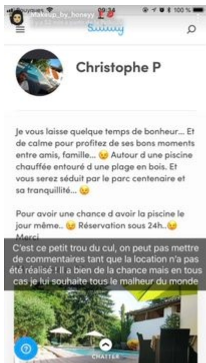
Illustration : Le Figaro

écrit par Yann Kempenich | 24 juillet 2018