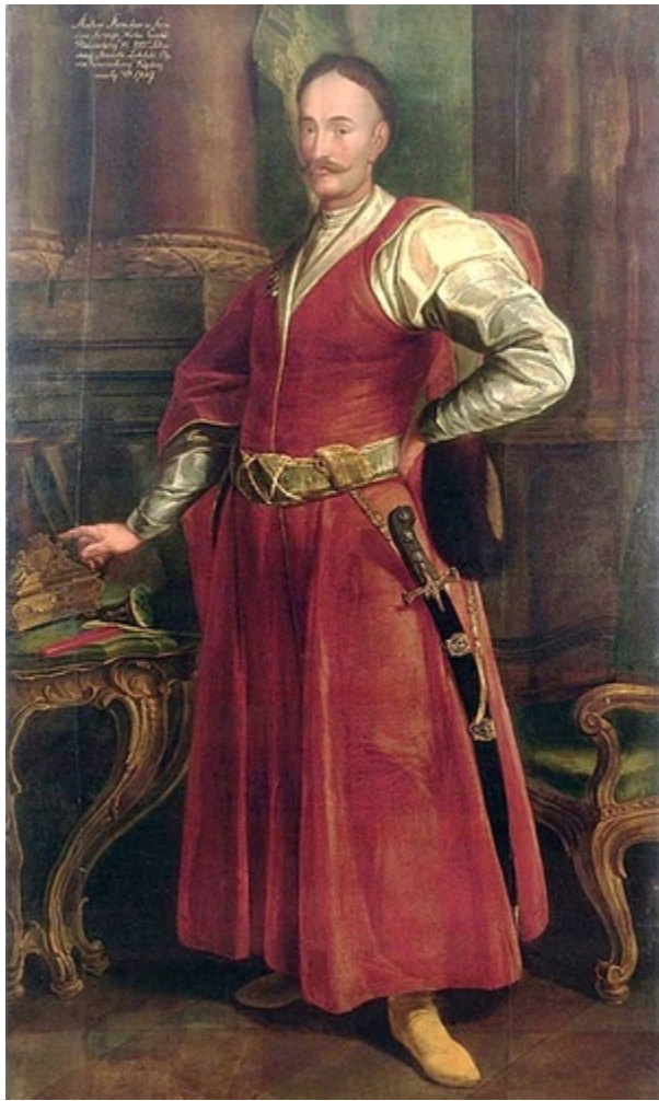
Stanislaw Szczuka (1654-1710), chef de file de la noblesse polonaise en tenue sarmate.

Les opposants au PiS reprochent à ce dernier (comme c'est le cas pour d' autres partis civilisationnistes ) de nourrir des craintes imaginaires et des sentiments trompeurs à l'égard du pouvoir politique. Hormis le siège de Vienne de 1683, ils soulignent les liens historiques positifs qu'entretiennent les Polonais avec les musulmans en insistant sur les sept siècles de relations exemplaires avec l'infime minorité musulmane turcophone vivant en Pologne, les Tatars Lipka, sur la conception romantique de l'origine iranienne (« Sarmate ») de la noblesse polonaise, sur le refus par l'Empire ottoman de reconnaître la partition de la Pologne et, au début des années 2000, sur l'accueil chaleureux réservé aux migrants tchéchènes arrivant en Pologne par le PiS lui-même.