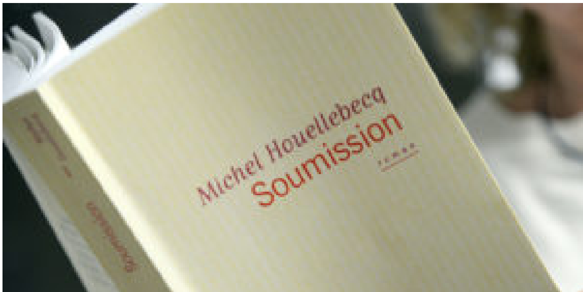
“Soumission”, roman paru aux éditions Flammarion

Comme le précisait avec délice Télérama en octobre 2015, “Soumission” n’est aucunement islamophobe : c’est une satire de la société française.