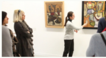
GROUPES ADULTES +