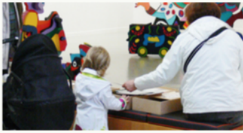
INDIVIDUELS ET FAMILLES +