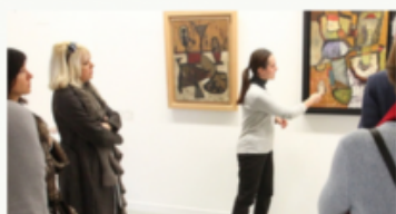
GROUPES ADULTES +