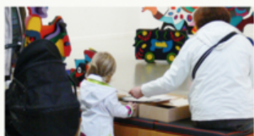
INDIVIDUELS ET FAMILLES +