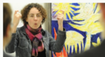
ACCUEILS ADAPTÉS +