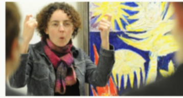
ACCUEILS ADAPTÉS +