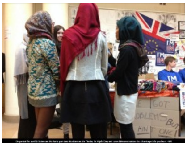
Organisé fin avril à Sciences Po Paris par des étudiants de l'école, le Hijab Day est une démonstration du changement à la jeunesse. -10-