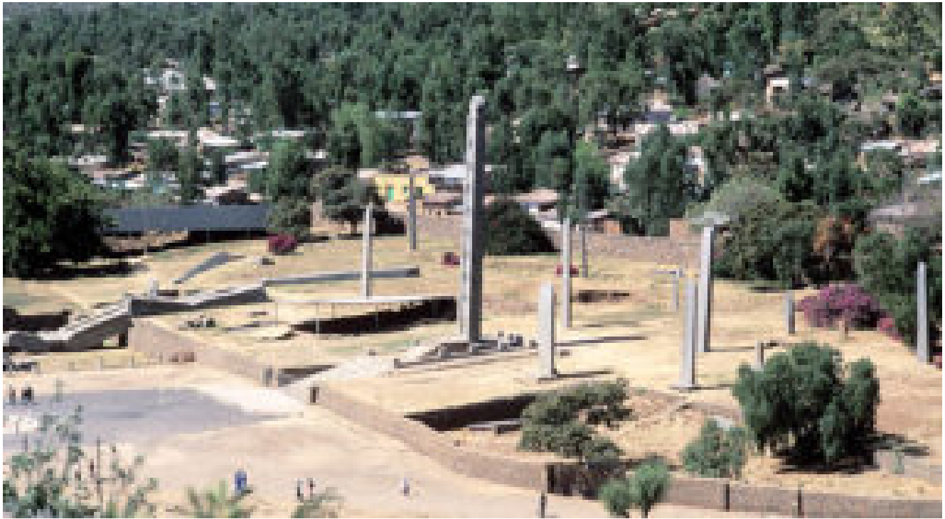
Illustration : obélisque d'Axoum. Aksoum ou Axoum (አኦሙ, Aksum) est une ville septentrionale d' Éthiopie , dans la province du Tigré . C'est l'un des centres religieux de l' Église éthiopienne orthodoxe . Aksoum a été le centre de l' empire aksoumite entre le i er et le vi e siècle de notre ère. Le site archéologique où se trouvent les obélisques d'Aksoum a été inscrit sur la liste du patrimoine mondial de l'UNESCO en 1980 . Dans les alentours de la ville se trouvent de nombreux autres sites datés de cette période antique. Wikipedia