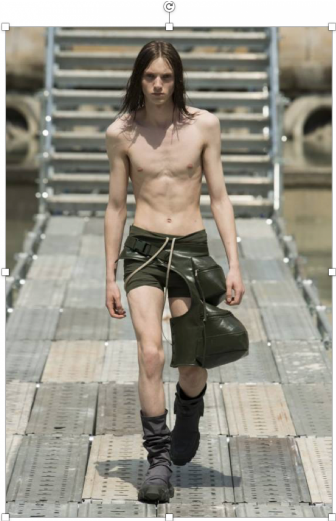
Illustration : une publicité parmi tant d'autres...