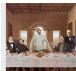
L'islam vu par des ex-musulmans @LislamVuParDesExMusulmans

écrit par Marcher sur des oeufs | 30 janvier 2018