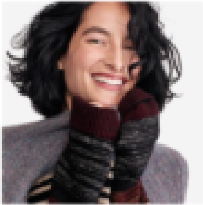
Look 1: The perfect winter * The essential outfit