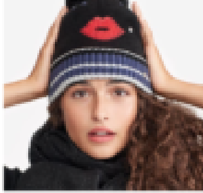
Look 2: The perfect winter * The essential outfit