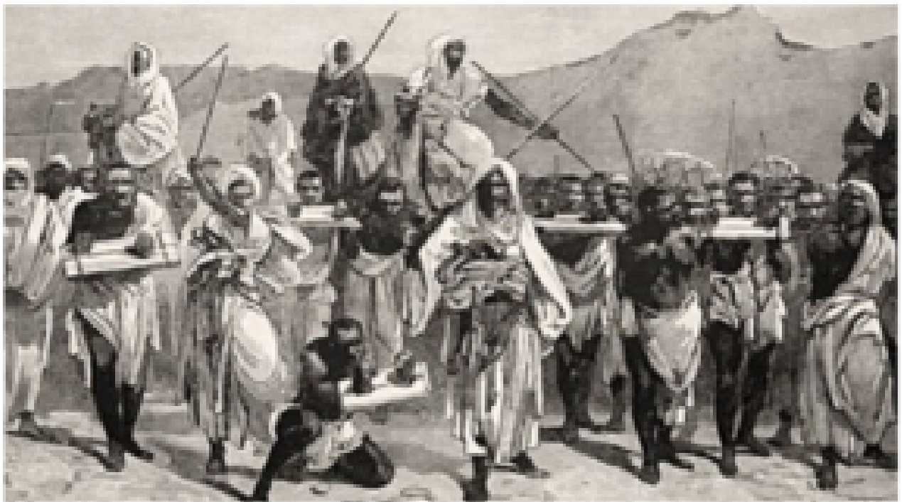
Selon l'anthropologue algérien Tidiane N'Diaye, les Arabes ont razzié l'Afrique subsaharienne pendant l'ère saïbée sans interruption

Un représentation de la vie de Mahomet pour faire pendant à la naissance de Jésus ?