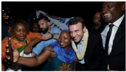
Emmanuel Macron (2eD) pose pour un selfie avec une femme et le maire de Dzaoudzi Said Omar Oili (D) à son arrivée à Mayotte le 26 mars 2017

Q - Pouvez-vous préciser le contenu de la feuille de route franco-comorienne adoptée le 12 septembre, qui vise à favoriser "les échanges humains entre les îles de l'archipel dans un cadre légal et en renforçant la sécurité des liaisons maritimes et aériennes" ? En quoi le régime des visas entre l'Union des Comores et Mayotte va-t-il être assoupli ?