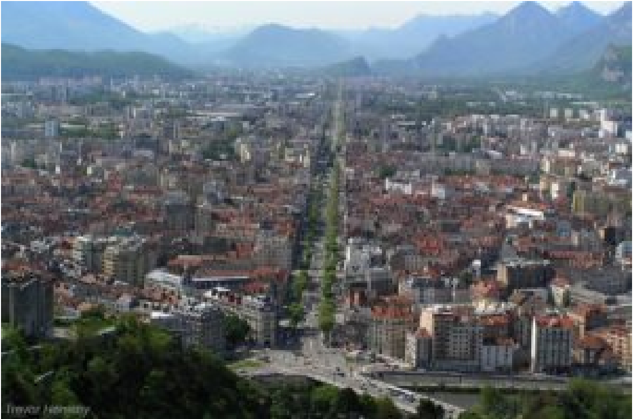
le “Cours de la Libération-et-du-Général-de-Gaule”

1) à Grenoble, si vous avez le temps, empruntez la troisième plus longue avenue d'Europe, le “Cours de la Libération-et-du-Général-de-Gaule” et ses 7,8 km. A 30 km/h, vous aurez le temps d'admirer les massifs du Vercors, de Chartreuse et de Belledonne.