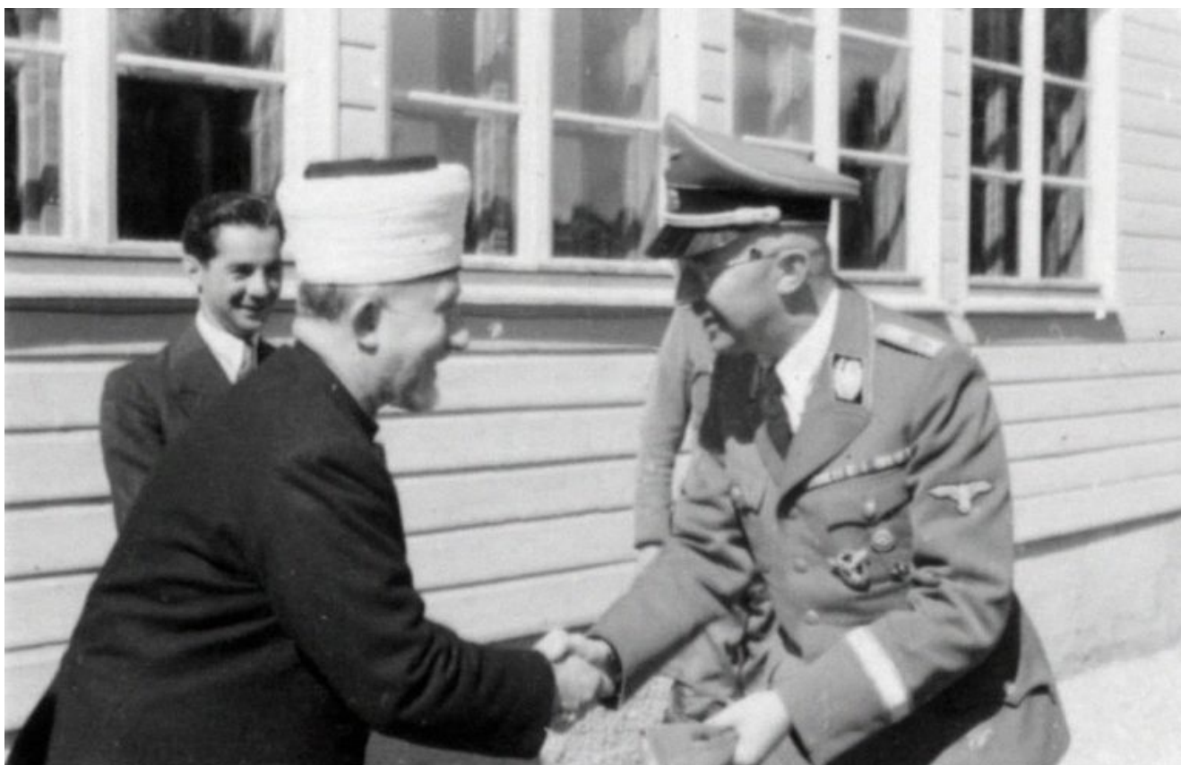
Bundesarchiv, Bild 101111-Aber-104-18A Foto: Aber, Kurt | 1943 ca.