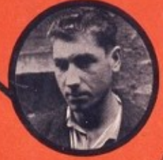
FONTANOT COMMUNISTE ITALIEN 12 ATTENTATS