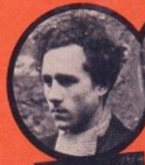
WITCHITZ JUIF POLONAIS 15 ATTENTATS