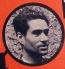
ALFONSO ESPAGNOL ROUGE 7 ATTENTATS