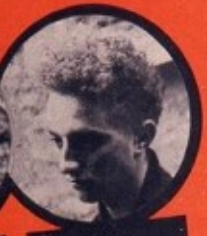
ELEK JUIF HONGROIS 8 DÉRAILLEMENTS