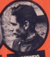
FINGERWEIG JUIF POLONAIS 3 ATTENTATS - 5 DÉRAILLEMENTS