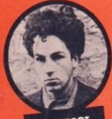
WASJBROT JUIF POLONAIS 1 ATTENTAT - 3 DÉRAILLEMENTS