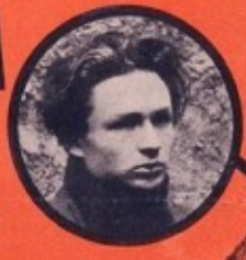
RAYMAN JUIF POLONAIS 18 ATTENTATS