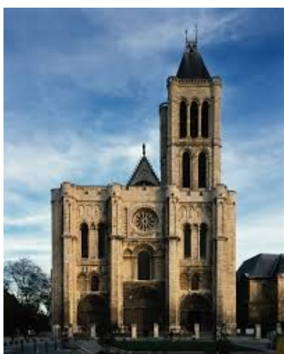
Illustration : photo prise à Saint-Denis.

écrit par Republica Islamaya Francarabia | 4 août 2017