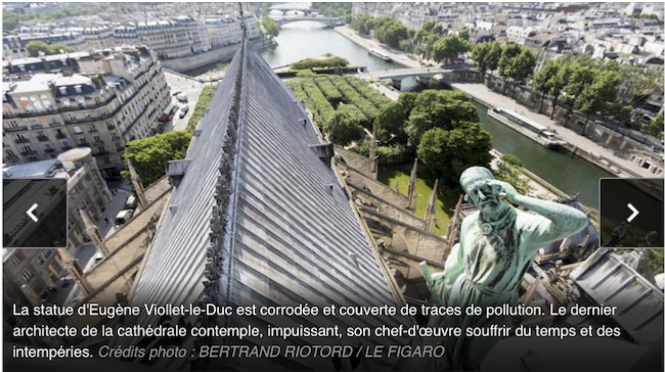
La statue d'Eugène Viollet-le-Duc est corrodée et couverte de traces de pollution. Le dernier architecte de la cathédrale contemple, impuissant, son chef-d'œuvre souffrir du temps et des intempéries.

À l'origine, les pierres utilisées venaient du bassin parisien. Au fil des nécessités, on les a remplacées par des blocs issus d'autres carrières. Selon Philippe Villeneuve, l'architecte des monuments historiques en charge de Notre Dame de Paris, le mélange des «qualités» ferait jouer les murs et les structures. Au moins trois des arcs-boutants seraient au bord de l'explosion.