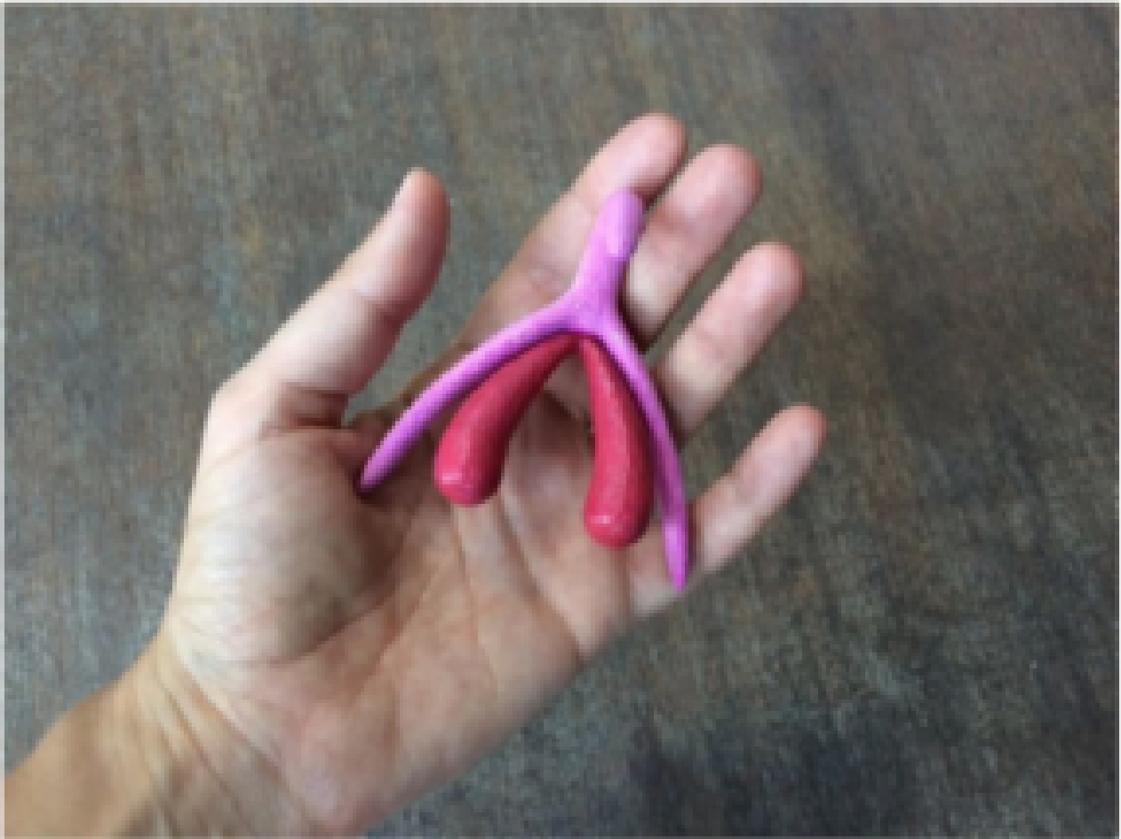
Un clitoris en 3D pour «expliquer le plaisir aux élèves»

http://resistancerepublicaine.com/2016/09/01/rentree-demandez-le-programme-arabe-et-maniement-du-clitoris/