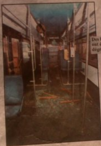
Des bâtons cloutés ont été utilisés pour dégrader le bus

Dès lundi matin, le comité d'hygiène, de sécurité et des