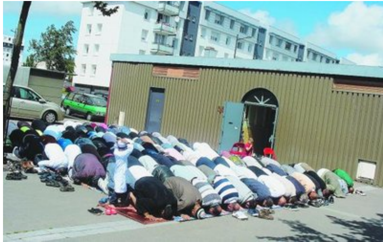
Prière dans la rue à l'occasion du Ramadan, dans le quartier de la Mare Rouge Mosquées au Havre