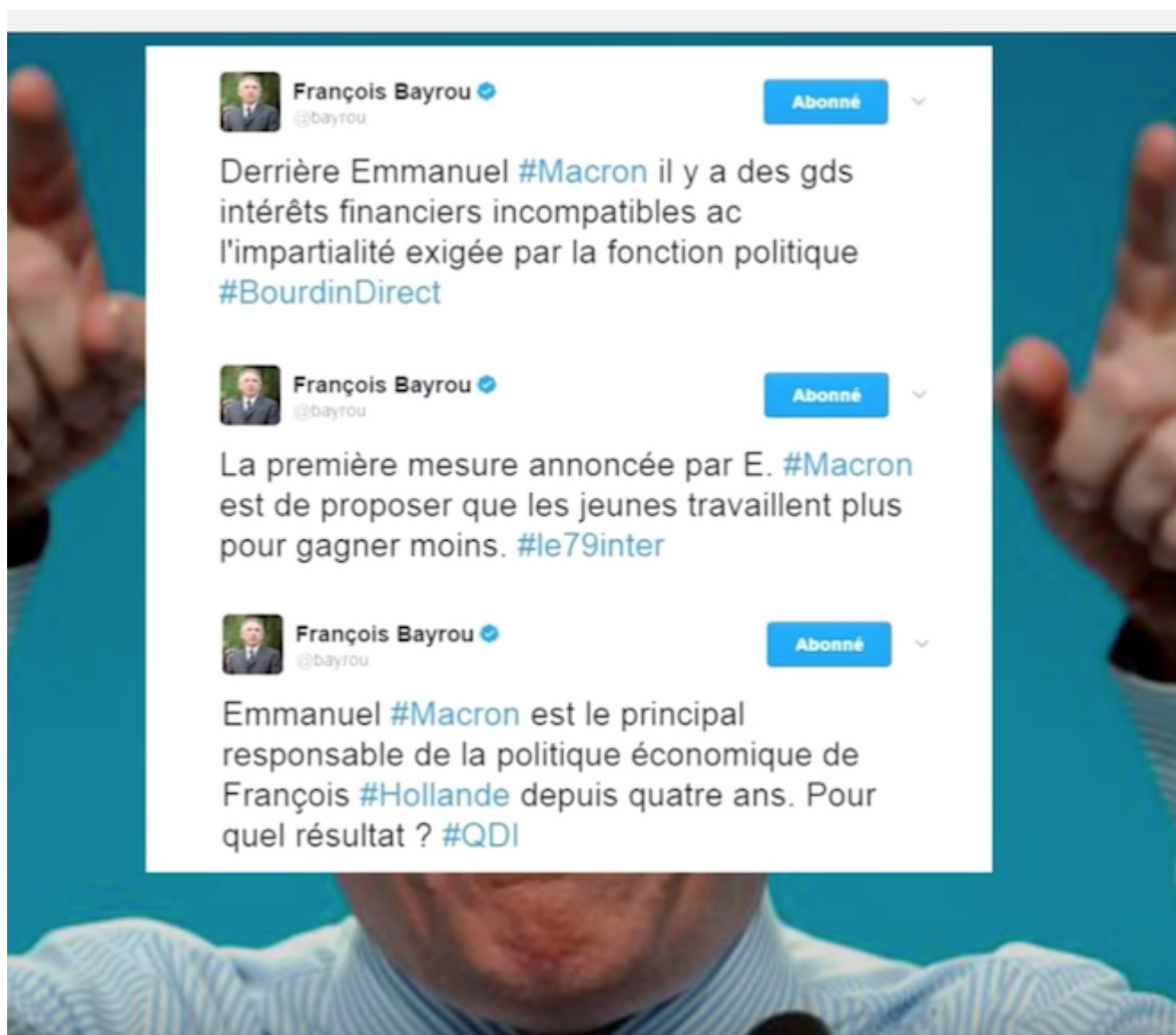
Illustration de Tcho http://tchodessin.fr

écrit par Professeur Loic Mansard | 30 avril 2017