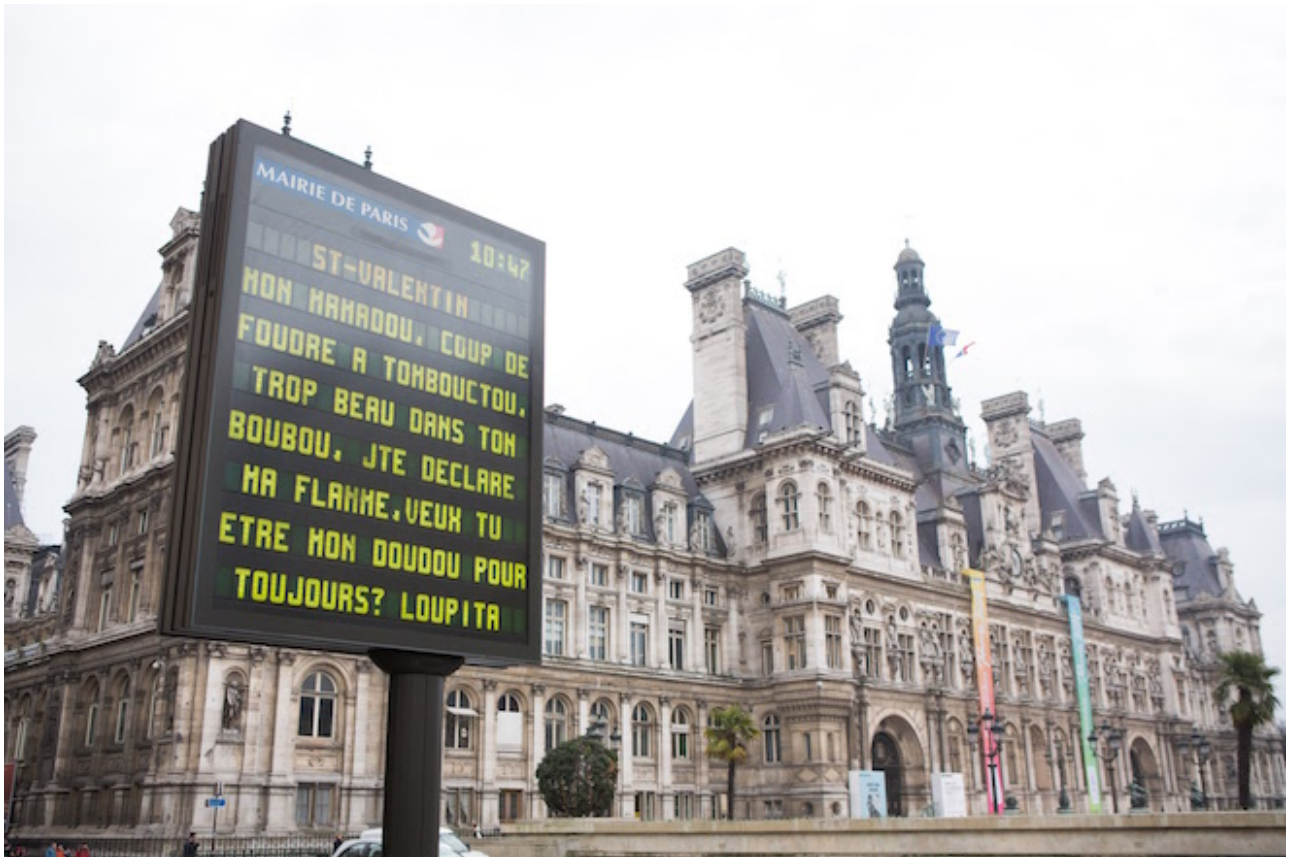
Message St Valentin