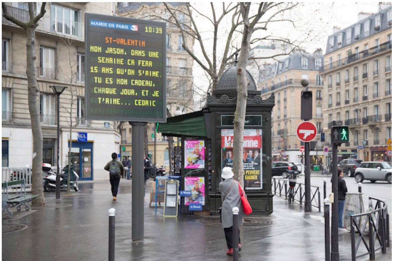
Et en anglais, siouplait...