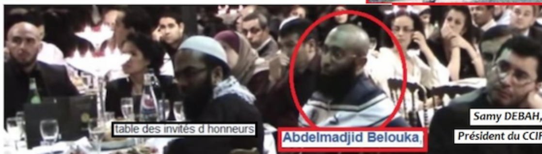
table des invités d honneurs