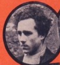
WITCHITZ JUIF POLONAIS 15 ATTENTATS