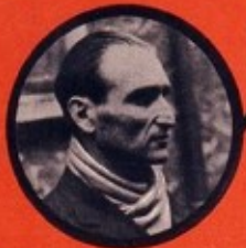
BOCZOV JUIF HONGROIS CHEF DÉRAILLEUR 20 ATTENTATS