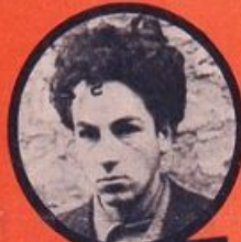
WASJBROT JUIF POLONAIS 1 ATTENTAT - 3 DÉRAILLEMENTS