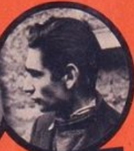
FINGERWEIG JUIF POLONAIS 3 ATTENTATS - 6 DÉRAILLEMENTS