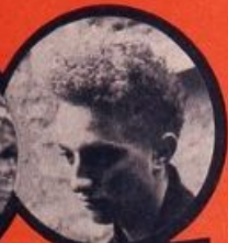
ELEK JUIF HONGROIS 8 DÉRAILLEMENTS