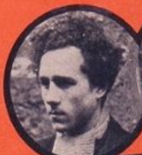
WITCHITZ JUIF POLONAIS 15 ATTENTATS