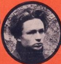
RAYMAN JUIF POLONAIS 13 ATTENTATS