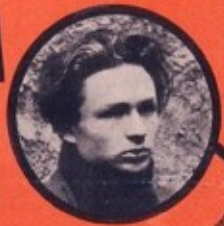
RAYMAN JUIF POLONAIS 18 ATTENTATS