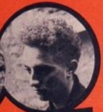
ELEK JUIF HONGROIS 8 DÉRAILLEMENTS