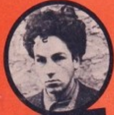
WASJBROT JUIF POLONAIS 1 ATTENTAT - 3 DÉRAILLEMENTS