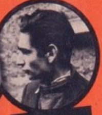
FINGERWEIG JUIF POLONAIS 3 ATTENTATS - 5 DÉRAILLEMENTS