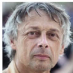
Pierre Cassen Fondateur de Riposte Laïque