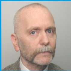
Renaud Camus Président du Parti de l'innocence