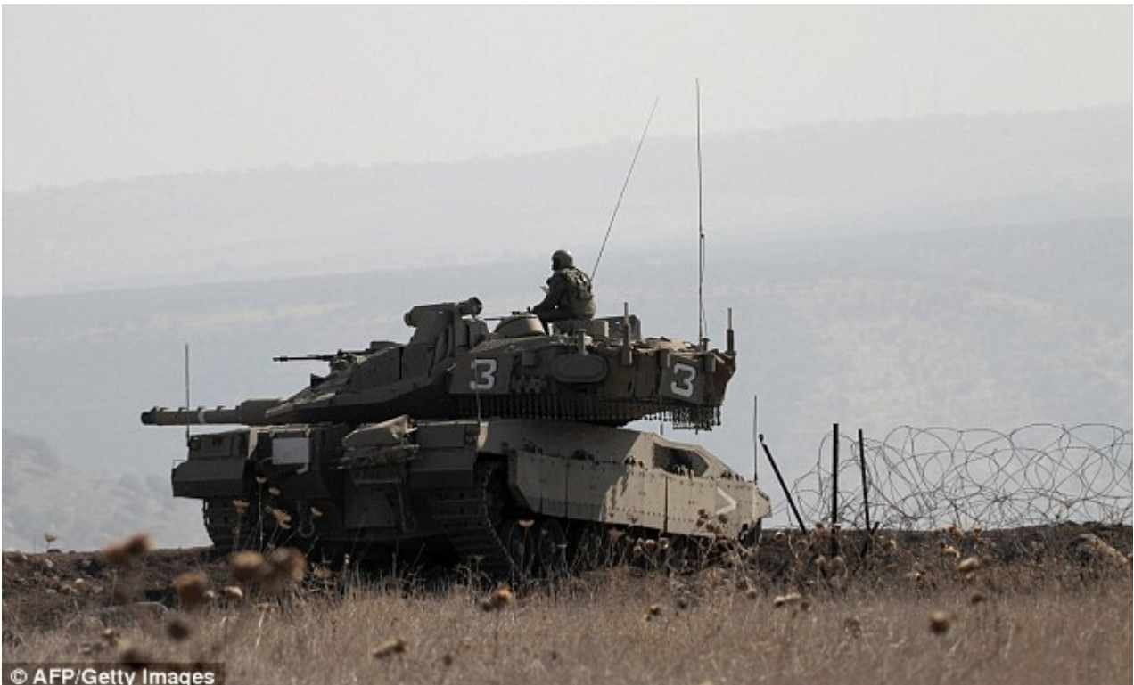
Soldats israéliens sur un char d'assaut près du village de Ma'rbah dans le sud du Plateau du Golan prise aujourd'hui après l'affrontement avec un groupe qui a fait allégeance à l'EI.