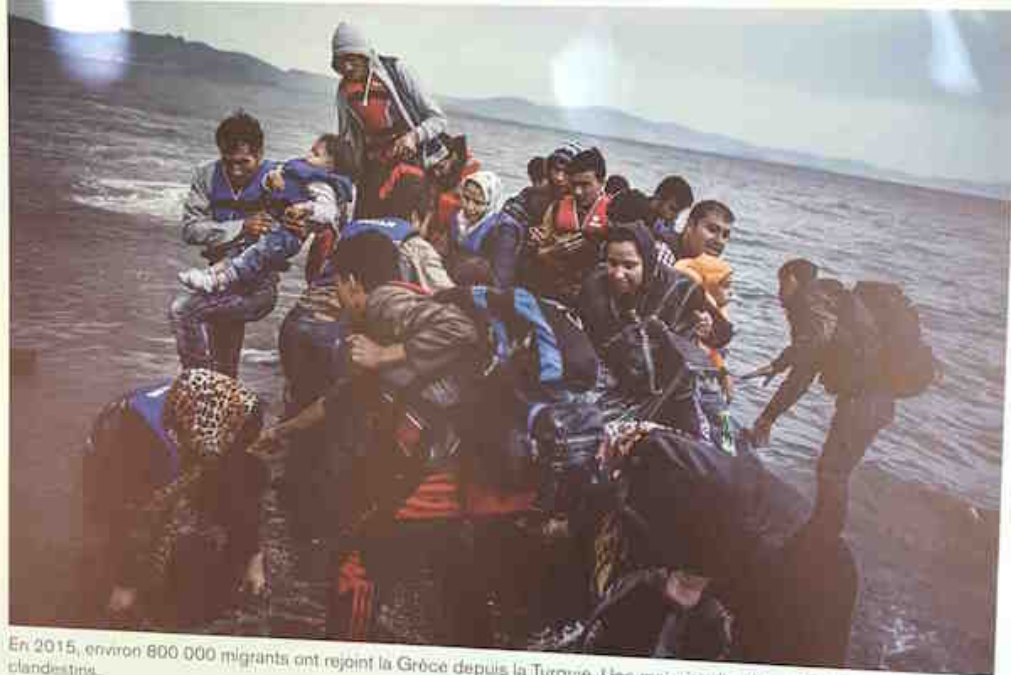
En 2015, environ 800 000 migrants ont rejoint la Grèce depuis la Turquie. Une majorité d'entre eux ont traversé la mer en clandestins. In 2015, around 800,000 migrants made their way to Greece from Turkey, most of them crossing the sea without visas.