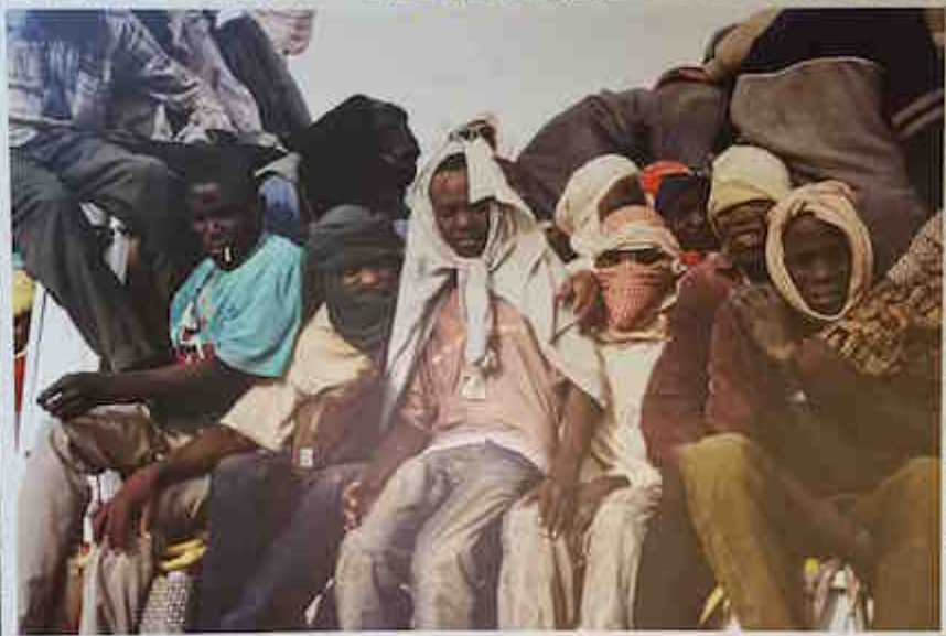
Les hommes sont assis sur le pont du bateau, dans l'attente de l'arrivée à destination. Certains portent des vêtements traditionnels. Malgré le froid, ils sont vêtus de vêtements légers, à l'exception d'un d'eux.