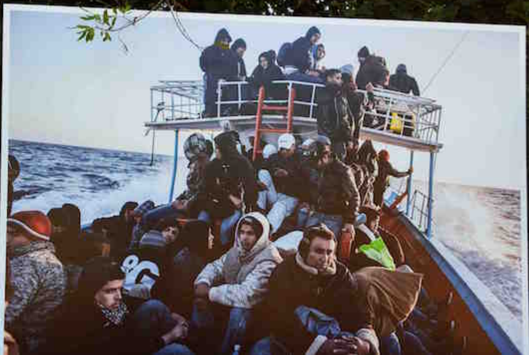
The men are sitting on the deck of the boat, waiting for the arrival at the destination. Some are wearing traditional clothing. Despite the cold, they are not wearing anything more on the deck. The temperature is 10°C.