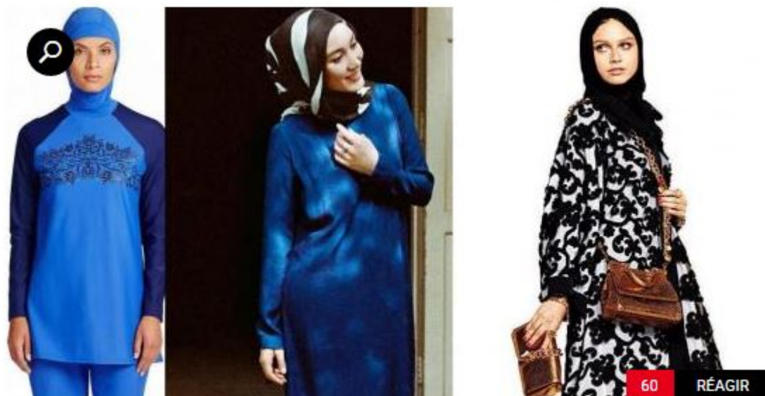
Marks&Spencer/Uniqlo/Dolce & Gabbana

http://resistancerepublicaine.com/2016/03/29/la-mode-halal-se-repand-silence-de-lagerfeld-gauthier-indignation-dagnes-b/