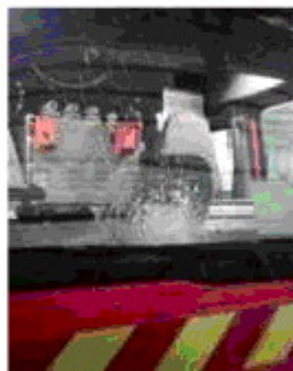
Le pare-brise du fourgon porte la trace de l'impact.

Le syndicat Unsa-Sdis 64 dénonce « une agression inacceptable et gratuite », « un guet-apens » (avec des jets de pierre lancés en cloche pour atteindre les hommes derrière