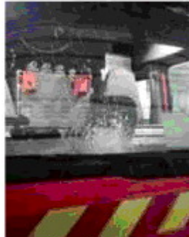
Le pare-brise du fourgon porte la trace de l'impact.

Le syndicat Unsa-Sdis 64 dénonce « une agression inacceptable et gratuite », « un guet-apens » (avec des jets de pierre lancés en cloche pour atteindre les hommes derrière