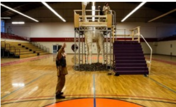
SPORTS ARENA Vs FAST SLEEP RESTAURANT

Fabriquer un lit confortable dans un lieu improbable avec des matériaux recyclés C'est le challenge que relèvent actuellement 20 équipes de jeunes architectes venus de toute l'Europe à Mannheim. Le projet