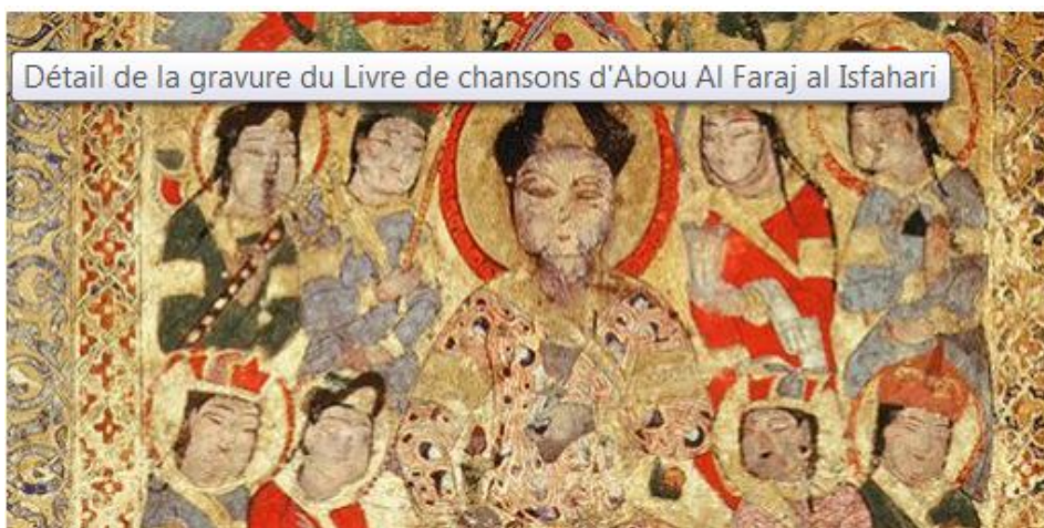
Poète entouré de femmes. Détail de la gravure du Livre de chansons d'Abou Al Faraj al Isfahari.

écrit par Christine Tasin | 5 février 2015