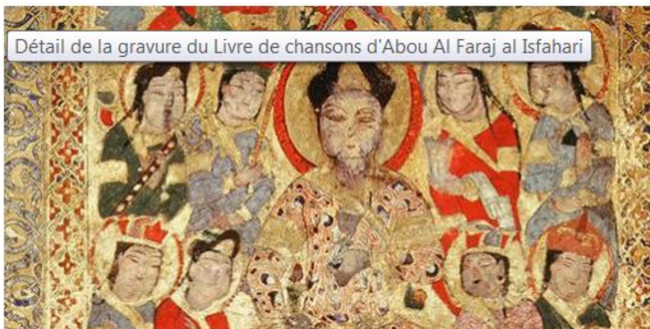
Poète entouré de femmes. Détail de la gravure du Livre de chansons d'Abou Al Faraj al Isfahari.

C'est une nouvelle terrible. Effroyable. Le patrimoine de l'humanité aux mains des barbares, c'est l'humanité qui disparaît.