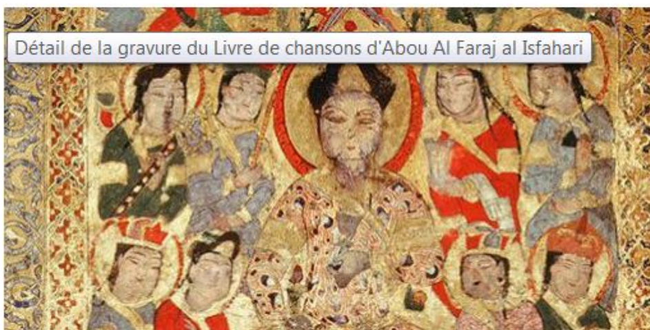
Poète entouré de femmes. Détail de la gravure du Livre de chansons d'Abou Al Faraj al Isfahari.

écrit par Christine Tasin | 5 février 2015