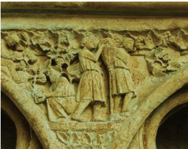
Scène de vendanges, portail de la cathédrale de Bourges