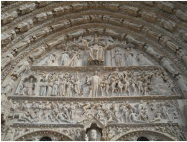
Portail de la cathédrale de Bourges