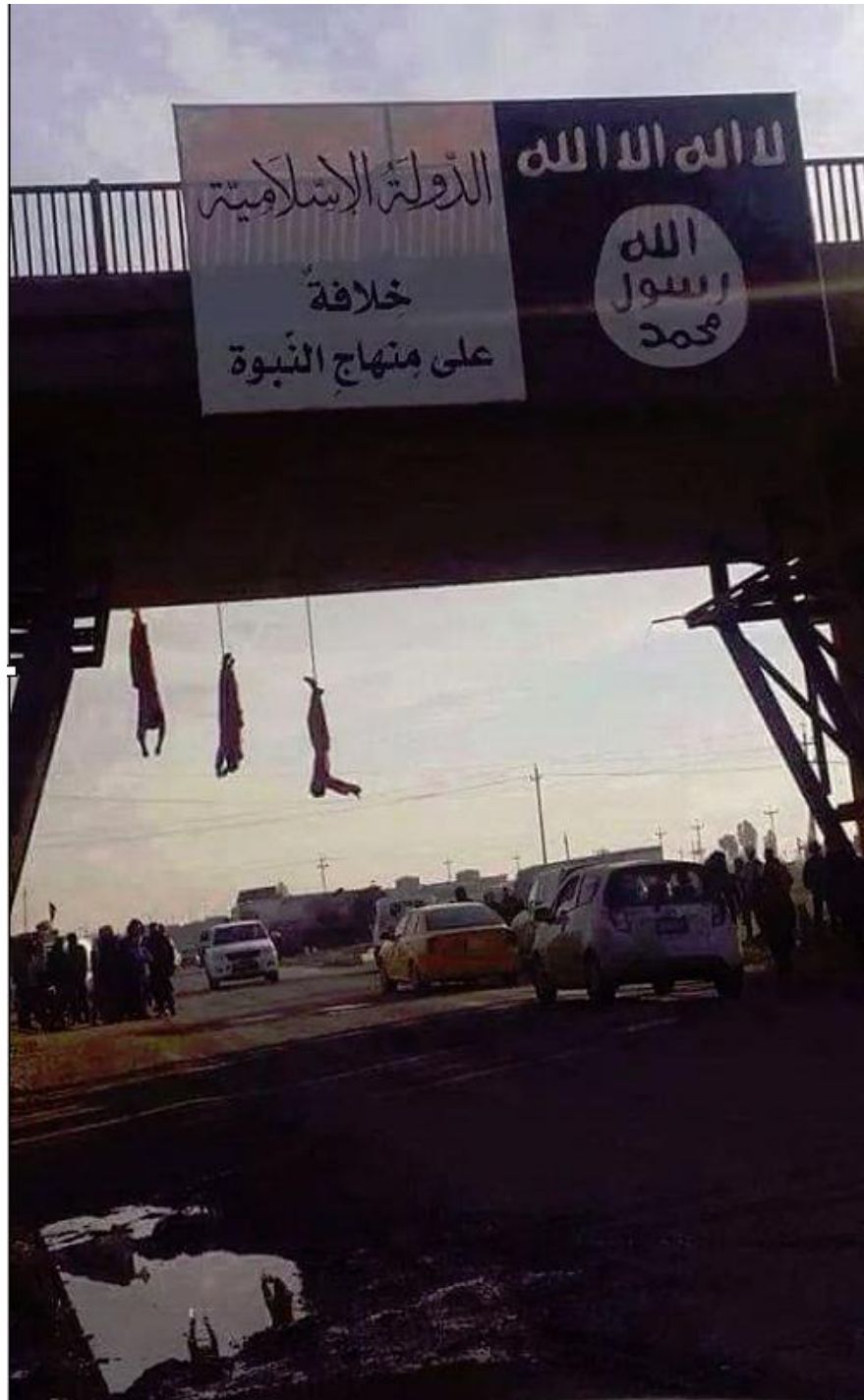
À l'entrée de la ville de Racca