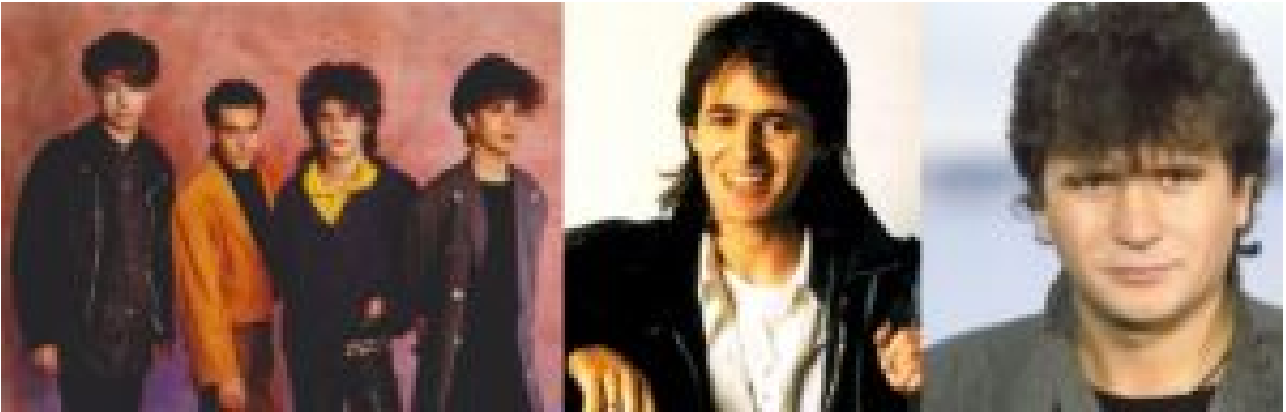
Années 80 : génération SIDA, chômage et touffes folles