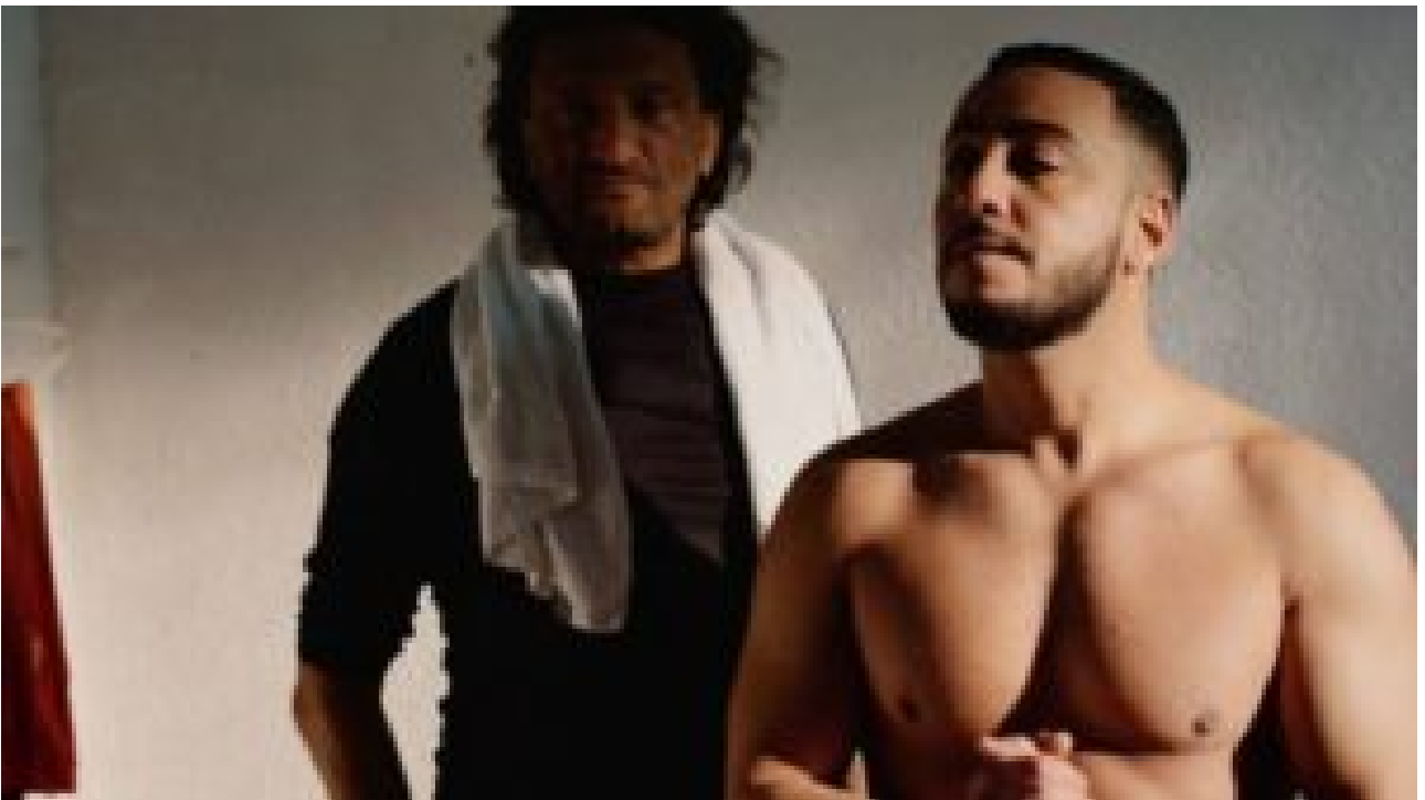
« Lacrim »