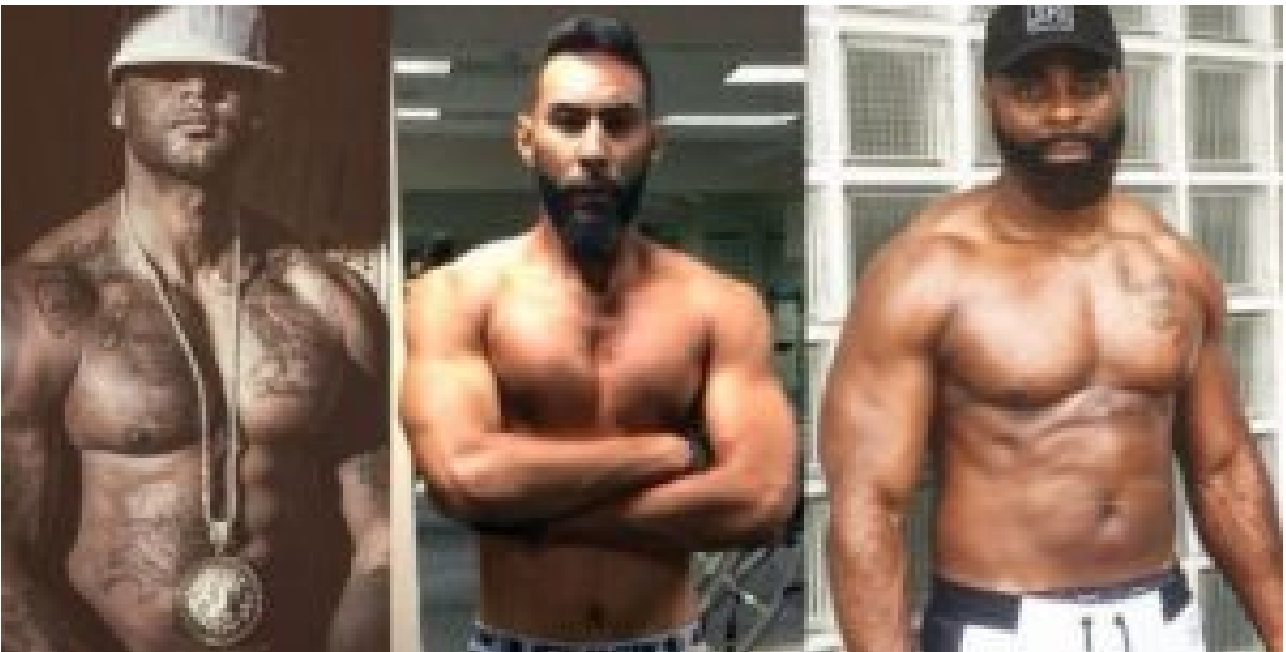
Aujourd'hui : la chanson française, ce nouveau zoo peuplé de dingues vociférant sa haine de tout