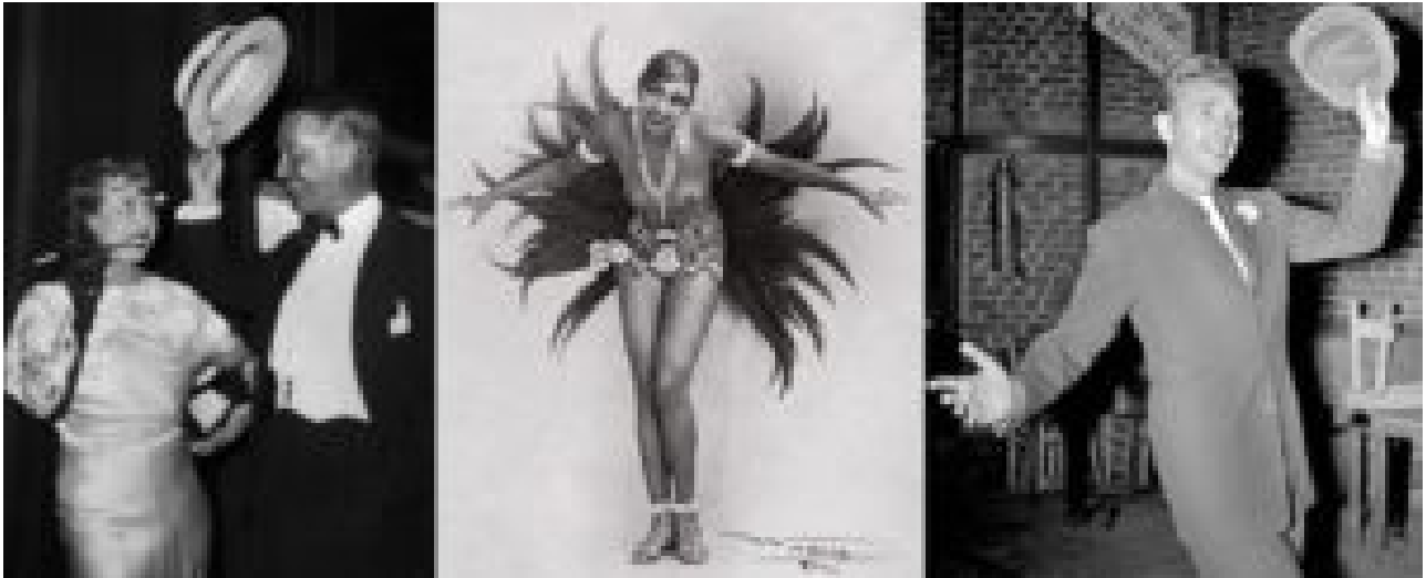
Années 30 : panamas, bananes, frou-frous et sourires... la bonne humeur est au rendez-vous