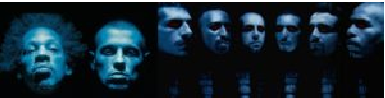
Années 90 : la naissance du rap français et foison de sales gueules