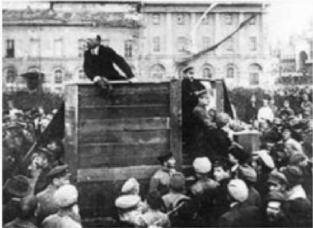
Cliché non-troué d'un photographe inconnu

Cette photographie a été prise sur la place Sverdlov à Moscou, devant le théâtre de Bolchoï, par un photographe inconnu. Elle montre des unités de l'Armée rouge rassemblées le 5 mai 1920. Au milieu de la place se trouve une estrade de bois, sur laquelle se trouve Vladimir Ilitch Lénine (voir sa biographie), gardé par Trotski (voir sa biographie) et Kamenev.