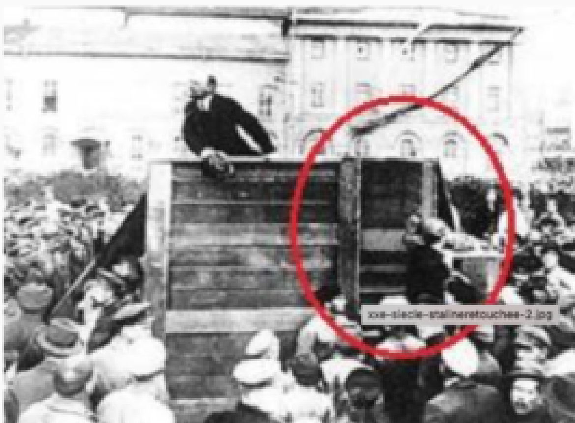
Photographie truquée de G.P Goldstein

Et oui, les jeunes macroniens ont beau faire une pub d'enfer à l'usurpateur, il y a partout des gens libres et sains qui osent montrer, démontrer, démonter les manoeuvres et les mensonges de Macron-Staline.