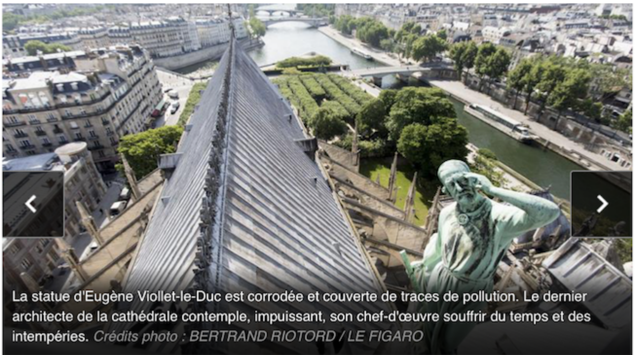
La statue d'Eugène Viollet-le-Duc est corrodée et couverte de traces de pollution. Le dernier architecte de la cathédrale contemple, impuissant, son chef-d'œuvre souffrir du temps et des intempéries.

À l'origine, les pierres utilisées venaient du bassin parisien. Au fil des nécessités, on les a remplacées par des blocs issus d'autres carrières. Selon Philippe Villeneuve, l'architecte des monuments historiques en charge de Notre Dame de Paris, le mélange des «qualités» ferait jouer les murs et les structures. Au moins trois des arcs-boutants seraient au bord de l'explosion.