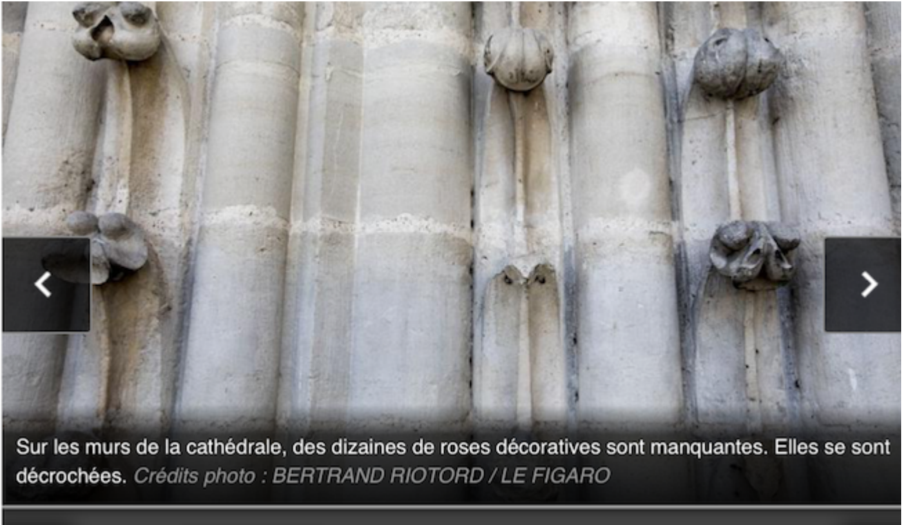
Sur les murs de la cathédrale, des dizaines de roses décoratives sont manquantes. Elles se sont décrochées.