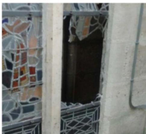
Saint-Denis, mardi 5 mars. DR

Ce ne sont pas les seuls dégâts relevés dans la cathédrale. Ce mardi, on a découvert que deux vitraux avaient été brisés. Il s'agit de deux éléments de la rose sud, qui fait actuellement l'objet d'une restauration. Deux serrures ont également été forcées.