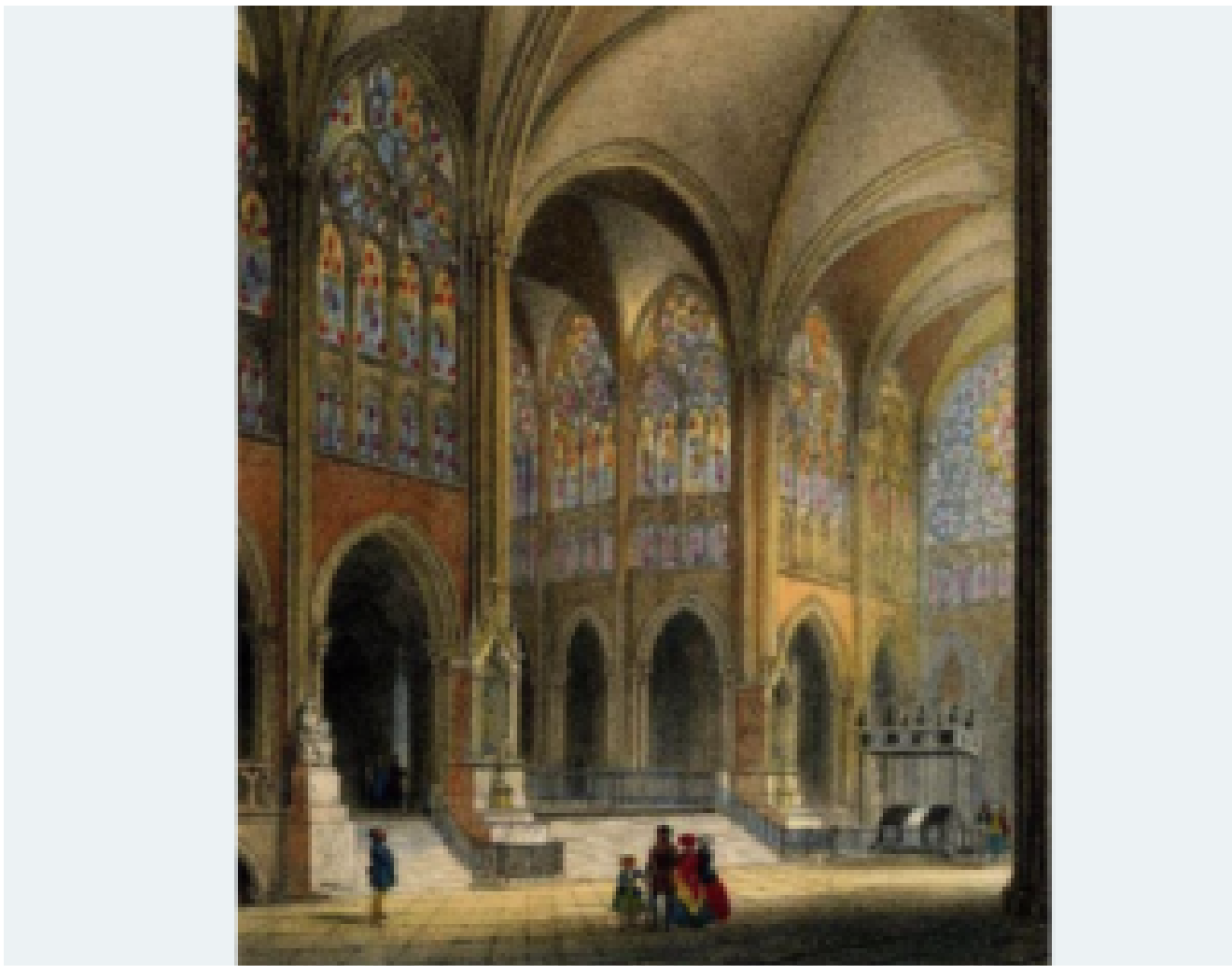
Eugène Delacroix (1797-1863), Intérieur de la basilique de Saint-Denis.

Il avait aussi ressuscité la technique du vitrail, alors passée de mode. L'exposition présente aussi quelques-unes de ses œuvres originales : deux plaques funéraires, un fragment de grille remarquable qui a été retrouvé, à l'abandon, dans les jardins jouxtant la basilique.