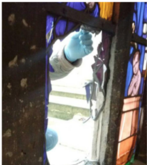
Saint-Denis, mardi 5 mars. Les vitraux de la rose sud de la basilique ont été cassés pour s'introduire dans l'édifice.