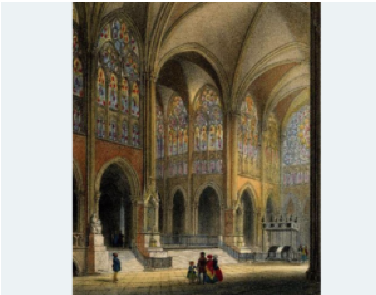
Eugène Delacroix (1797-1825), Intérieur de la basilique de Saint-Denis.

Il avait aussi ressuscité la technique du vitrail, alors passée de mode. L'exposition présente aussi quelques-unes de ses œuvres originales : deux plaques funéraires, un fragment de grille remarquable qui a été retrouvé, à l'abandon, dans les jardins jouxtant la basilique.