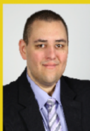
Secrétaire général du Syndicat France Police