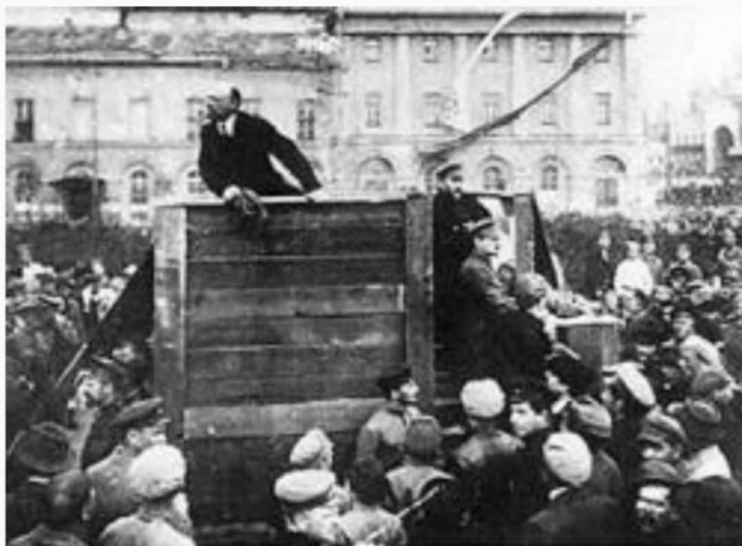
Cliché non-truqué d'un photographe inconnu

Cette photographie a été prise sur la place Sverdlov à Moscou, devant le théâtre du Bolchoï, par un photographe inconnu. Elle montre des unités de l'Armée rouge rassemblées le 5 mai 1920. Au milieu de la place se trouve une estrade de bois, sur laquelle se trouve Vladimir Illich Lénine ( voir sa biographie ), gardé par Trotski ( voir sa biographie ) et Kamenev.